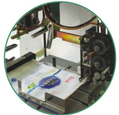
HIGH PERFORMANCE WEIGHING CONTROLLER (MODEL : MUT-2000) MATSUSHITA SCALE, JAPAN