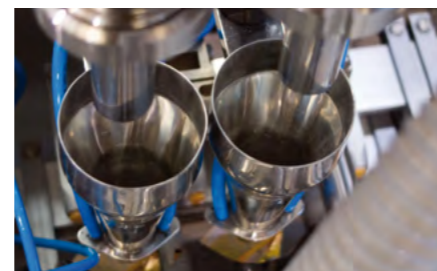
Dosing station top view.

Zona de las tijeras de corte del sobre y arrastre del film por servomotor.