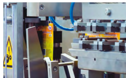
Scissor for pouch cutting, and film pulling by means of a servomotor.

Desbobinador con alineador de film incorporado. Posibilidad de acoplar una segunda bobina. Opcionalmente también se puede suministrar empalmador automático de bobina.