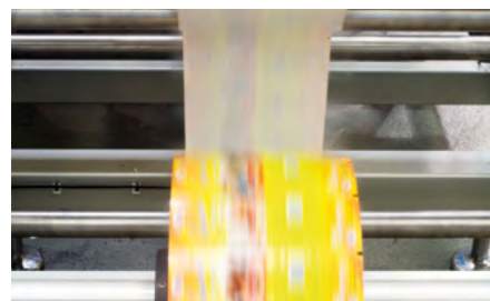
Unwinder with film alignment option to incorporate a second film reel and an automatic film splicer.

Desbobinador con alineador de film incorporado. Posibilidad de acoplar una segunda bobina. Opcionalmente también se puede suministrar empalmador automático de bobina.